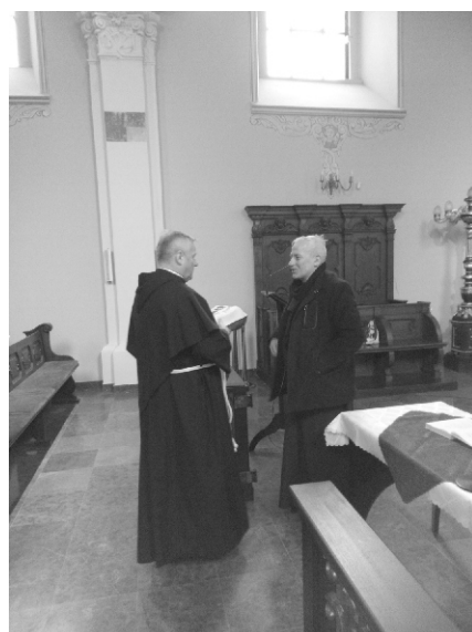
Wręczenie egzemplarzy autorskich